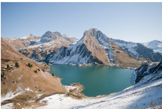
Der Spuller, ein traumhaft schöner Hochgebirgssee.

Tageskarte: €29 Entnahme: 6 Fische/Tag Schonmaß: 26 cm für alle Fischarten Saison 2012: 16. Juni bis 21. Oktober