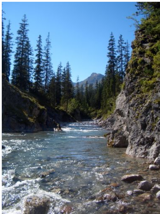
Der Lechbach, ein wilder Gebirgsbach von bezaubernder Schönheit...