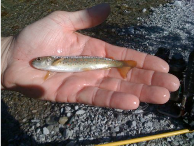
Eine wunderbar gezeichnete ca. einjährige Urforelle aus dem Schongebiet.