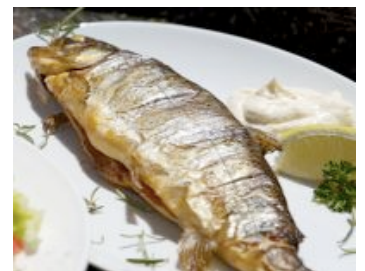
Der Fischteich in Zug, ideal für Einsteiger!

Direkt am Lechbach im Ortsteil Zug gelegen, ist der Fischteich Lech seit 1977 Treffpunkt für Angler und solche, die es noch werden wollen! Angelgerät und Köder werden hier zur Verfügung gestellt und mit ein paar kleinen Tipps steht dem Fang des ersten Fisches nichts mehr im Wege! Der Clou: die selbstgefangenen Forellen und Saiblinge werden auf Wunsch anschließend sofort zubereitet! Ob geräuchert oder gebraten, ein selbst gefangener Fisch schmeckt einfach immer besonders!