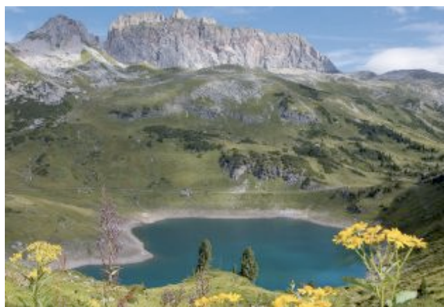
Der Formarinsee auf 1789m Seehöhe.