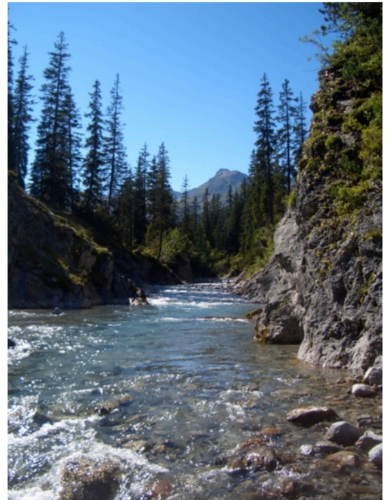
Der Lechbach, ein wilder Gebirgsbach von bezaubernder Schönheit...

Seit 2014 ist die obere Reviergrenze nicht mehr wie bisher die Einmündung des Markbaches, sondern die Einmündung des Spullerbaches! Dadurch verlängert sich das Revier um knapp 3,7 befischbare Kilometer. Besonders bei schlechtem Wetter birgt dieser obere Revierteil enorme Vorteile, ist er doch bei weitem nicht so hochwasseranfällig wie weiter flussab gelegene Abschnitte! Durch den neuen Lechweg ist auch eine gute Erreichbarkeit gewährleistet, freuen Sie sich auf diesen landschaftlich unwahrscheinlich reizvollen Teil des Lechbachs!