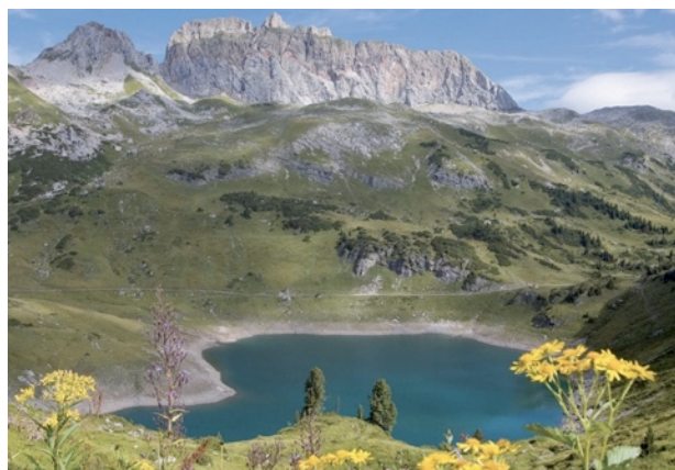
Der Formarinsee auf 1789m Seehöhe.

Tageskarte: €25 Entnahme: 5 Fische pro Tag Schonmaß: 25 cm für alle Fischarten Saison 2015: 15. Juni bis 30. September Bewirtschafter: Fischereiverein Klostersal