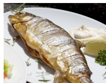
Der Fischteich in Zug, ideal für Einsteiger!

Direkt am Lechbach im Ortsteil Zug gelegen, ist der Fischteich Lech seit 1977 Treffpunkt für Angler und solche, die es noch werden wollen! Angelgerät und Köder werden hier zur Verfügung gestellt und mit ein paar kleinen Tipps steht dem Fang des ersten Fisches nichts mehr im Wege! Der Clou: die selbstgefangenen Forellen und Saiblinge werden auf Wunsch anschließend sofort zubereitet! Ob geräuchert oder gebraten, ein selbst gefangener Fisch schmeckt einfach immer besonders!